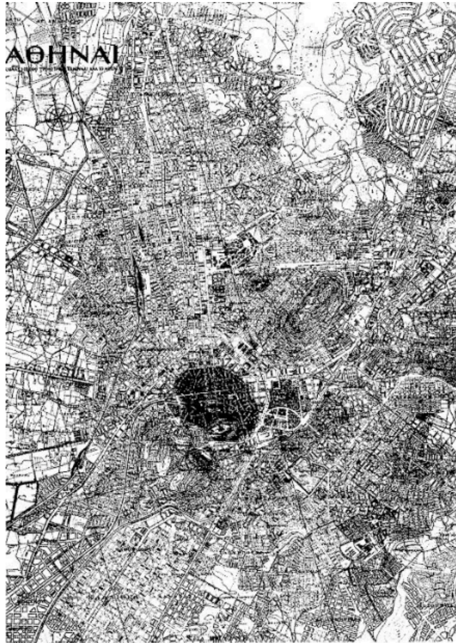
Είκ. 177. Χάρτης της πόλεως τῶν Ἀθηνῶν συνταχθεὶς ὑπὸ τοῦ ἀρχιτέκτονος Κάστα Μπίρ (1950). Δι' ἐντονωτέρου χρώματος σημειοῦμεν τὴν ἐκτασὴν τῆς πόλεως κατὰ τὰς ἀρχὰς τοῦ ἔτους 1929. Διὰ τὴν ἐκτασὴν τῆς πόλεως κατὰ τὰς ἀρχὰς τοῦ ἔτους 1929.