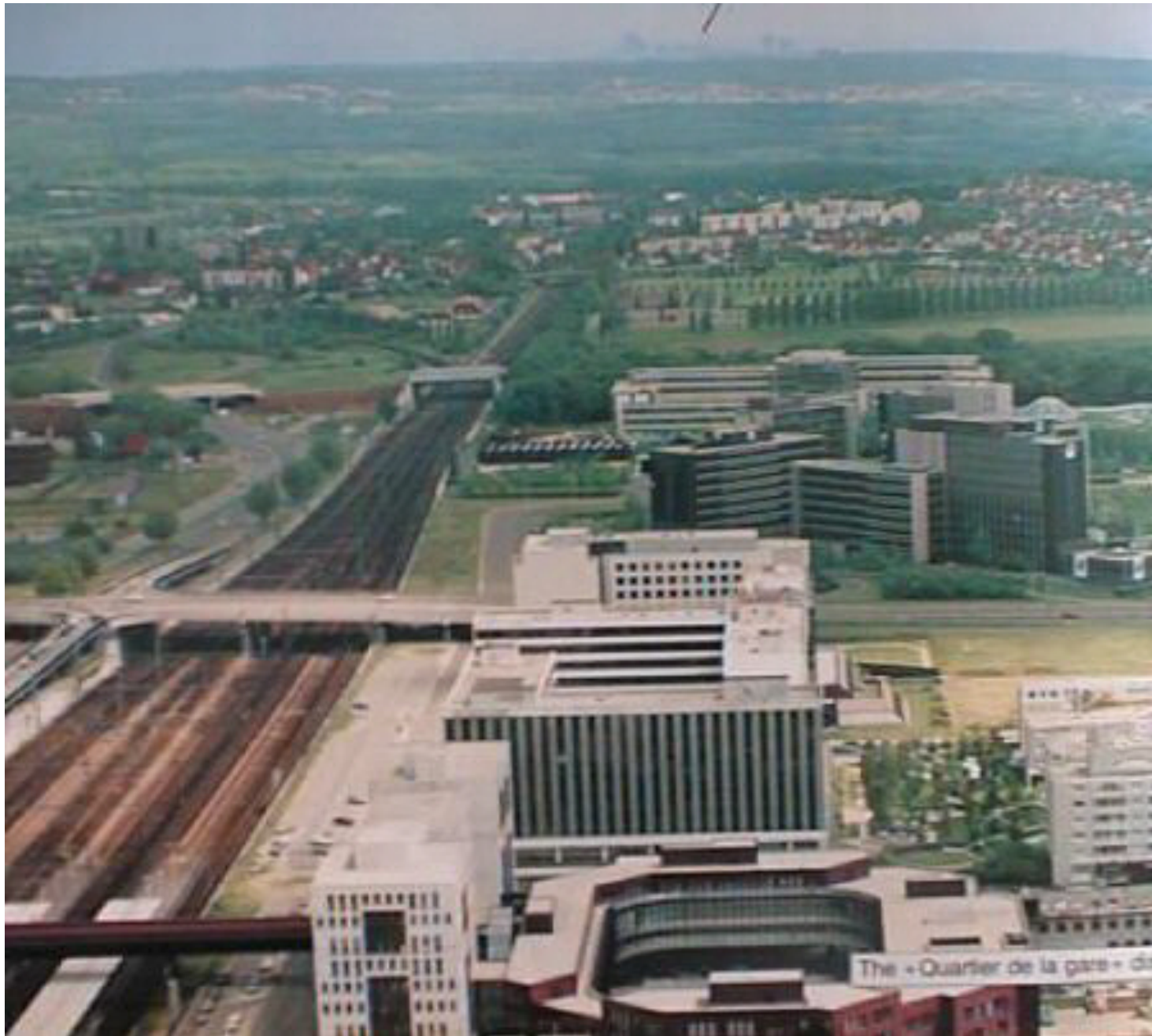
The «Quartier de la gare» de