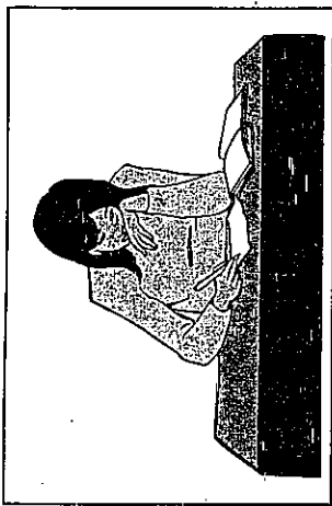
Κωδικοποίηση πρόδηλου περιεχομένου (Αντικειμενική) Η κωδικοποίηση του πρόδηλου περιεχομένου περιλαμβάνει τη μέτρηση συγκεκριμένων στοιχείων, όπως η λέξη έρωτας , προκειμένου να διαπιστωθεί αν και σε ποιο βαθμό το απόσπασμα πρέπει να κριθεί «ερωτικό».

Για αυτή τη δραστηριότητα πρέπει να χρησιμοποιηθούν και η επαγωγική και η παραγωγική μέθοδος. Αν ελέγχετε θεωρητικές προτάσεις, οι θεωρίες σας θα πρέπει