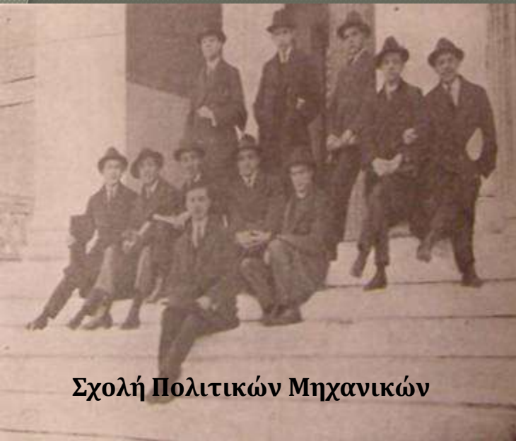
Σχολή Πολιτικών Μηχανικών