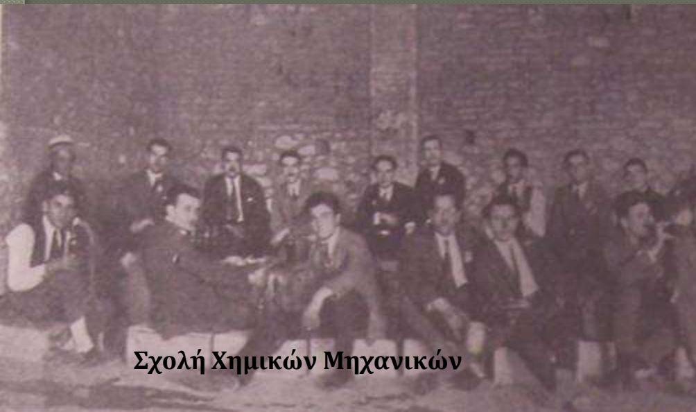
Σχολή Χημικών Μηχανικών