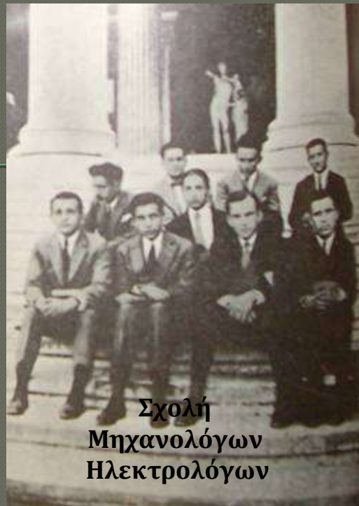
Σχολή Μηχανολόγων Ηλεκτρολόγων