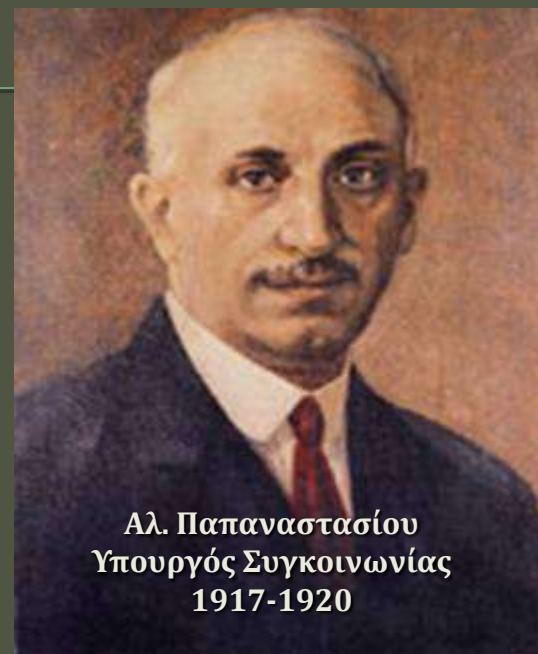
Αλ. Παπαναστασίου Υπουργός Συγκοινωνίας 1917-1920