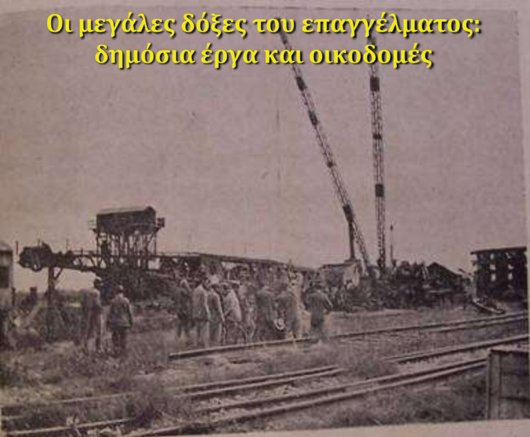
Οι έργοις έπισημπεύμενοι έκκαφία υπό έπισημην είς τό έργοστάσιον Μπανίτης