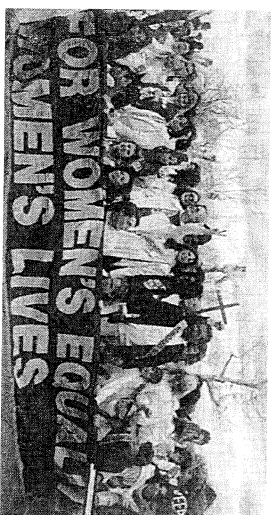
Η ισότητα για τις γυναίκες οδηγίες, τεχνικά, σε λιγότερη ισότητα για τα οικονομικά εισοδήματα.

Όπως δείξαμε με το πιο πάνω παράδειγμα, η διανομή του εισοδήματος καθορίζεται τόσο από κοινωνικούς όσο και από οικονομικούς παράγοντες. Επιπλέον, η αλάνουρευτική άποψη ότι «η εισοδηματική ανισότητα είναι κακή» μπορεί να είναι παραπλανητική. Η αύξηση των ευκαιριών που προσφέρονται στις γυναίκες υπήρξε αποφασιστική εξέλιξη για την κοινωνία, ακόμη και αν ένα από τα αποτελέσματά της ήταν η διεύθυνση της ανισότητας των οικογενειακών εισοδημάτων. Όταν αξιολογούν κάποια μεταβολή στη διανομή του εισοδήματος, οι πολιτικοί οφείλουν να εξετάσουν τους λόγους της μεταβολής πριν αποφασίσουν κατά πόσον αυτή θα προκάλεσει κάποιο κοινωνικό πρόβλημα.